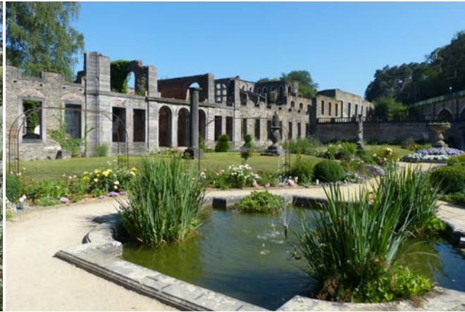
Ci-dessus : Les jardins du château d'Amboise (Indre-et-Loire - France).