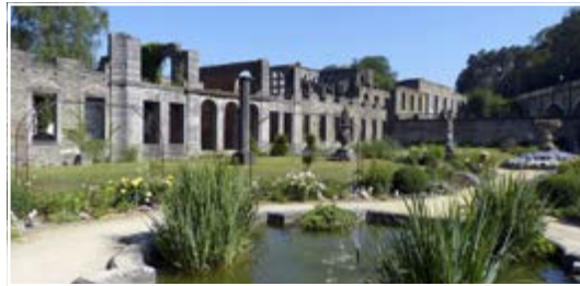
L'abbaye de Villers 1495 Villers-la-Ville (B)