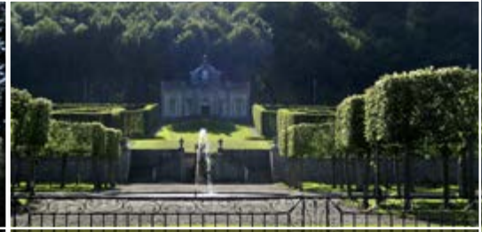
Les jardins de Freÿr 5540 Hastière (B)