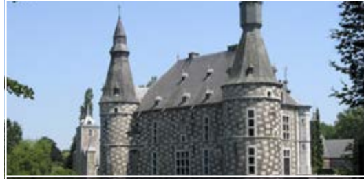
Les jardins du Château de Jehay 4540 Amay (B)