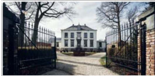
Le domaine du Bocage 7041 Givry (B)