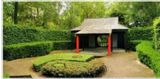
Les jardins du Lac de Bambois 5070 Fosses-la-Ville (B)