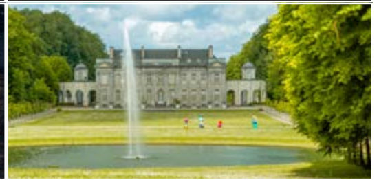
Parc du domaine du château de Seneffe 7180 Seneffe (B)