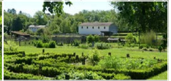
Les jardins gallo-romains de Malagne 5580 Rochefort (B)