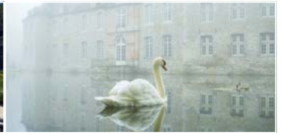
Les jardins d'Annevoie 5537 Anhée (B)