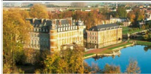
Le château de Beloeil 7970 Beloeil (B)

Les Jardins remarquables belges, membres actifs de l'Association des Amis des Jardins Remarquables Européens.