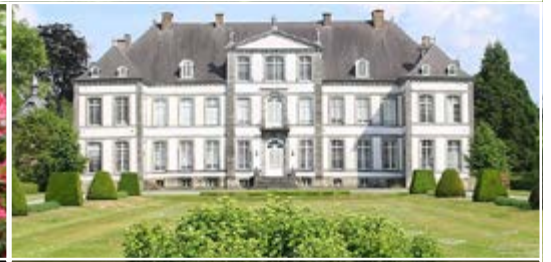
Le château d'Attre 7941 Brugelette (B)