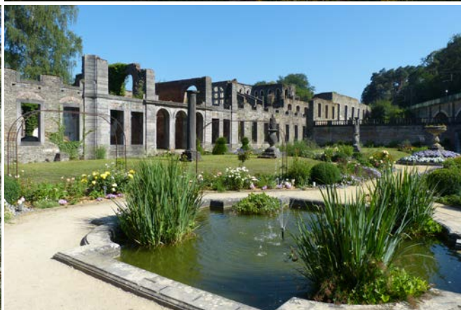
Ci-dessus : Les jardins du château d'Amboise (Indre-et-Loire - France).