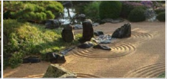
Le Jardin Zen Erik Borja 26600 Beaumont-Monteux (FR)