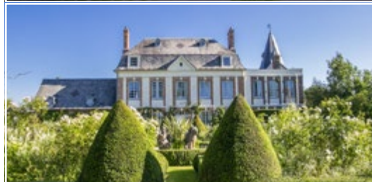
Les Jardins d'Angélique 76520 Montmain (FR)