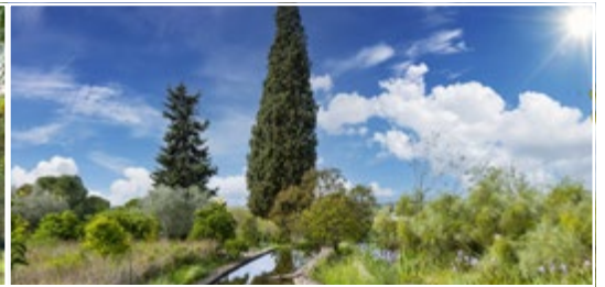
Les jardins du Musée Intl. de la Parfumerie 06370 Mouans-Sartoux (FR)