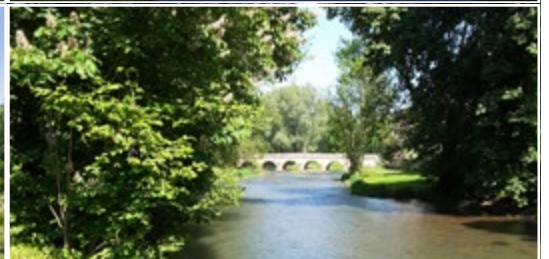
Le parc du château de la Varenne 55000 HIRONVILLE (FR)