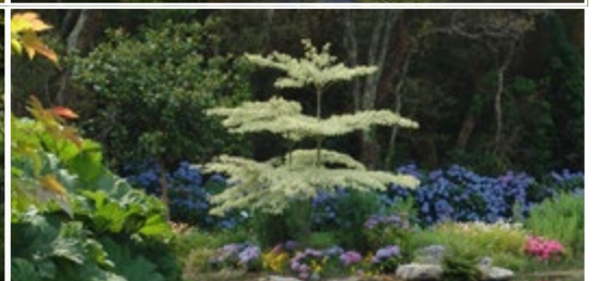
Le parc botanique de Cornouaille 29120 Combrit (FR)