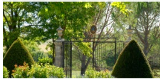
Le château de Sauvan Route d'Apt, 04300 Mane (FR)