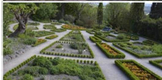
Le Jardin des Herbes - jardin communal 26700 La Garde-Adhémar (FR)