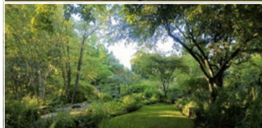
Le Jardin de Marguerite 67115 Plobsheim (FR)