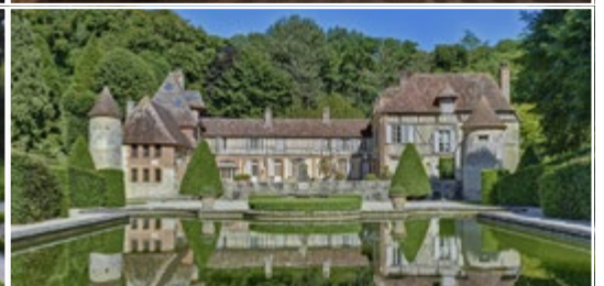
Château et Jardins de Boutemont 14100 OUILLY-LE-VICOMTE (FR)