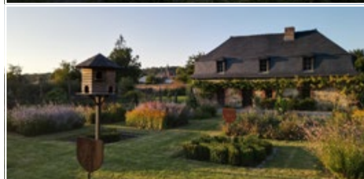
Parc et Jardin de Bosmont 02250 Bosmont-sur-Serre (FR)

Les nouveaux Jardins remarquables de mars 2023, membres actifs de l'Association des Amis des Jardins Remarquables Européens.