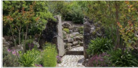
Le jardin de la Basse Fontaine 84110 Puyméras (FR)