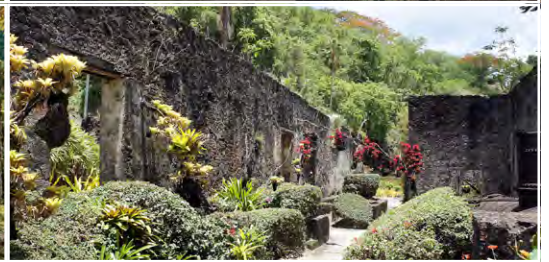
Le Jardin zoologique de Martinique 97221, Martinique (FR)