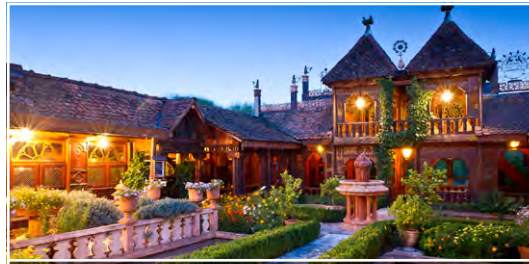
Les Jardins Secrets 74150 Vaulx (FR)