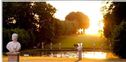
Les parc et jardins du château de Canon 14270 Mézidon-Canon (FR)