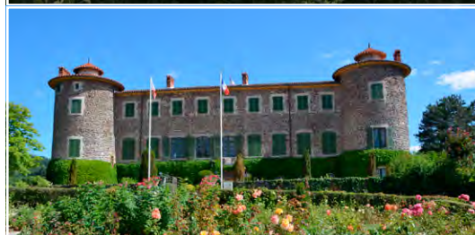
Le parc du château de Chavaniac-Lafayette 43230 Chavaniac-Lafayette (FR)

Les nouveaux Jardins remarquables de juillet 2023, membres actifs de l'Association des Amis des Jardins Remarquables Européens.