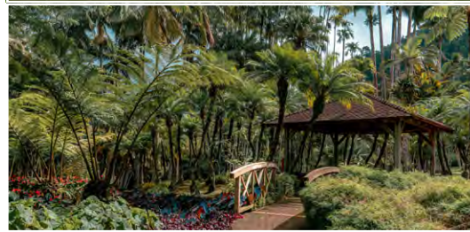
Le Jardin de Balata 97234, Martinique (FR)