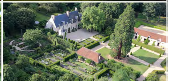
Le Domaine de Poulaines 36210 Poulaines (FR)