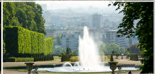
Le Domaine national de Saint-Cloud 92210 Saint-Cloud (FR)