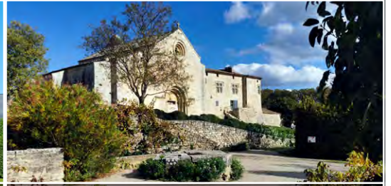
Les musée et jardins de Salagon 04300 Mane, (FR)