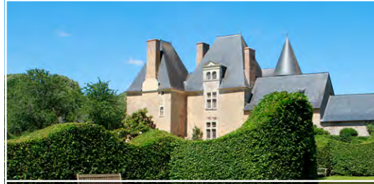
Le Manoir de Favry 53340 Préaux (FR)