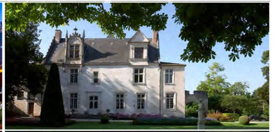
Le château de Beaulon 17240 Saint-Dizant-du-Gua (FR)