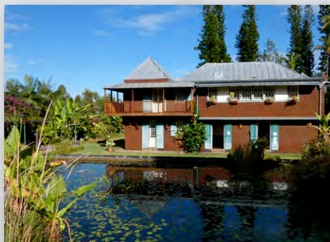
Le Conservatoire botanique national de Mascarin, île de la Réunion.

L'Association est particulièrement heureuse de compter, parmi ses nouveaux adhérents, les jardins de Martinique, le Jardin de Balata et le Jardin zoologique de Martinique. Ils viennent rejoindre « Mascarin », jardin botanique de La Réunion, dans les membres des départements, régions et collectivités d'outre-mer,