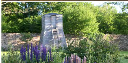
Les jardins du château de Losmonerie 87700 Aix-sur-Vienne (FR)